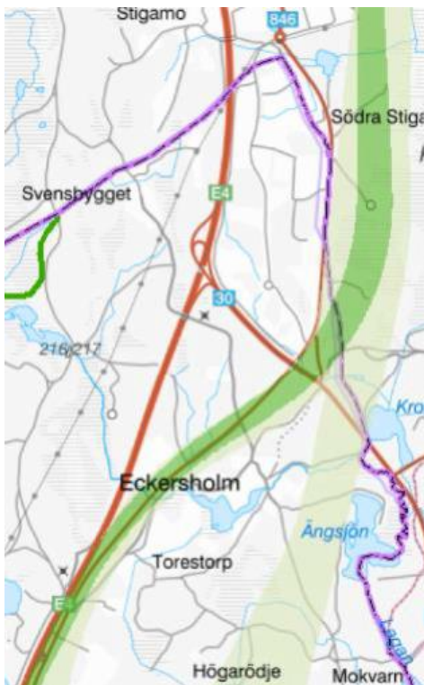
Figur 2 Valt alternativ för planerad järnvägssträckning mellan Byarum och Tenhult (grönt markerat område)

Inom ramen för Trafikverkets arbete med framtagande av järnvägsplan för ny järnväg mellan Byarum-Tenhult utreds var järnvägen mer exakt ska gå inom vald korridor. Som en del i detta studeras påverkan på väg 846 och om befintlig passage under väg 30 för väg 846 kan användas för järnvägen. Trafikverkets utredning av ny järnvägs påverkan på väg 846 syftar bland annat till att ge svar på om det finns en statlig nytta av att lägga 846 i nytt läge genom aktuellt område.